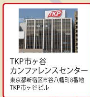
TKP市ヶ谷 カンファレンスセンター 東京都新宿区市谷八幡町8番地 TKP市ヶ谷ビル